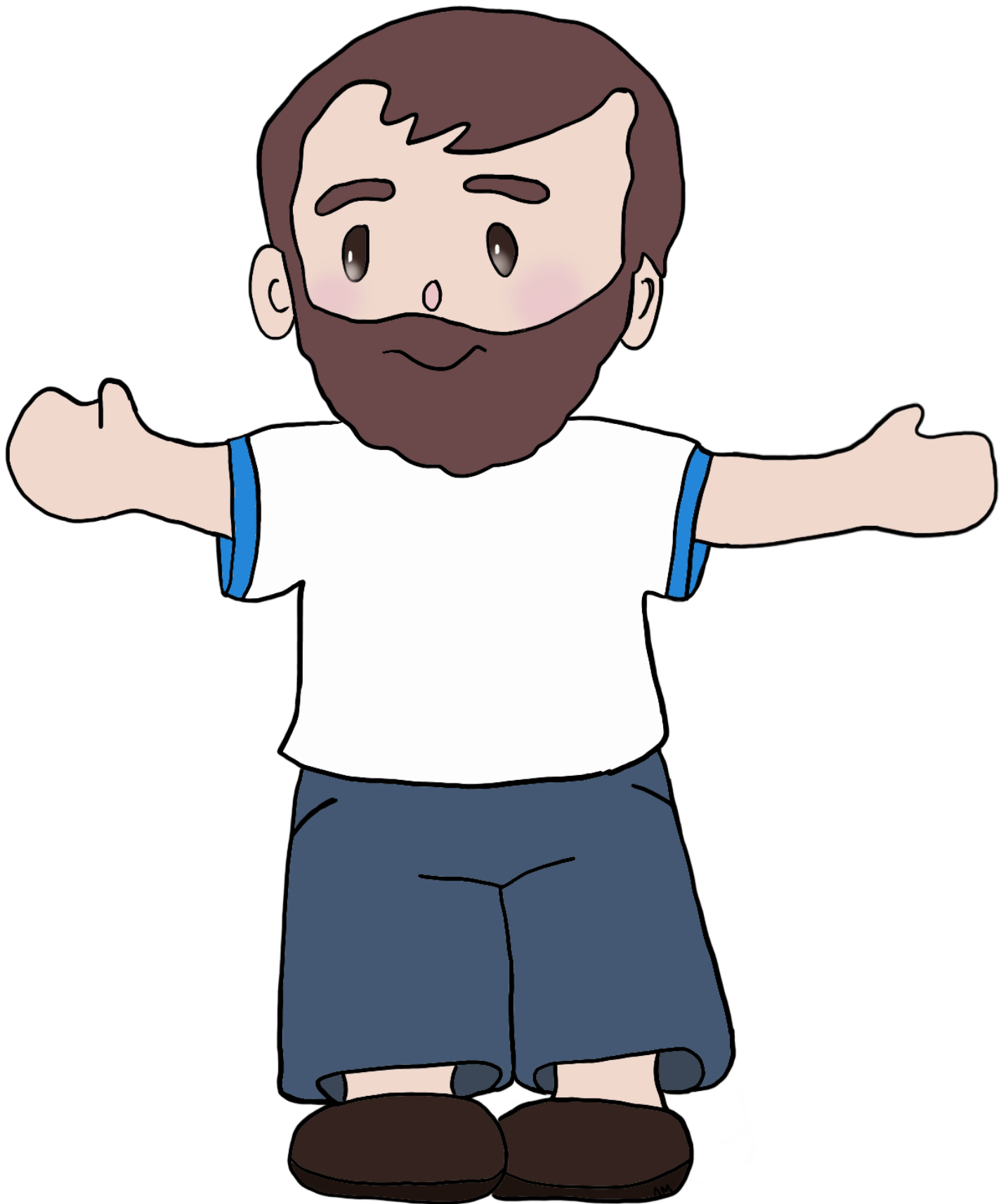
Le papa d'Amidéo