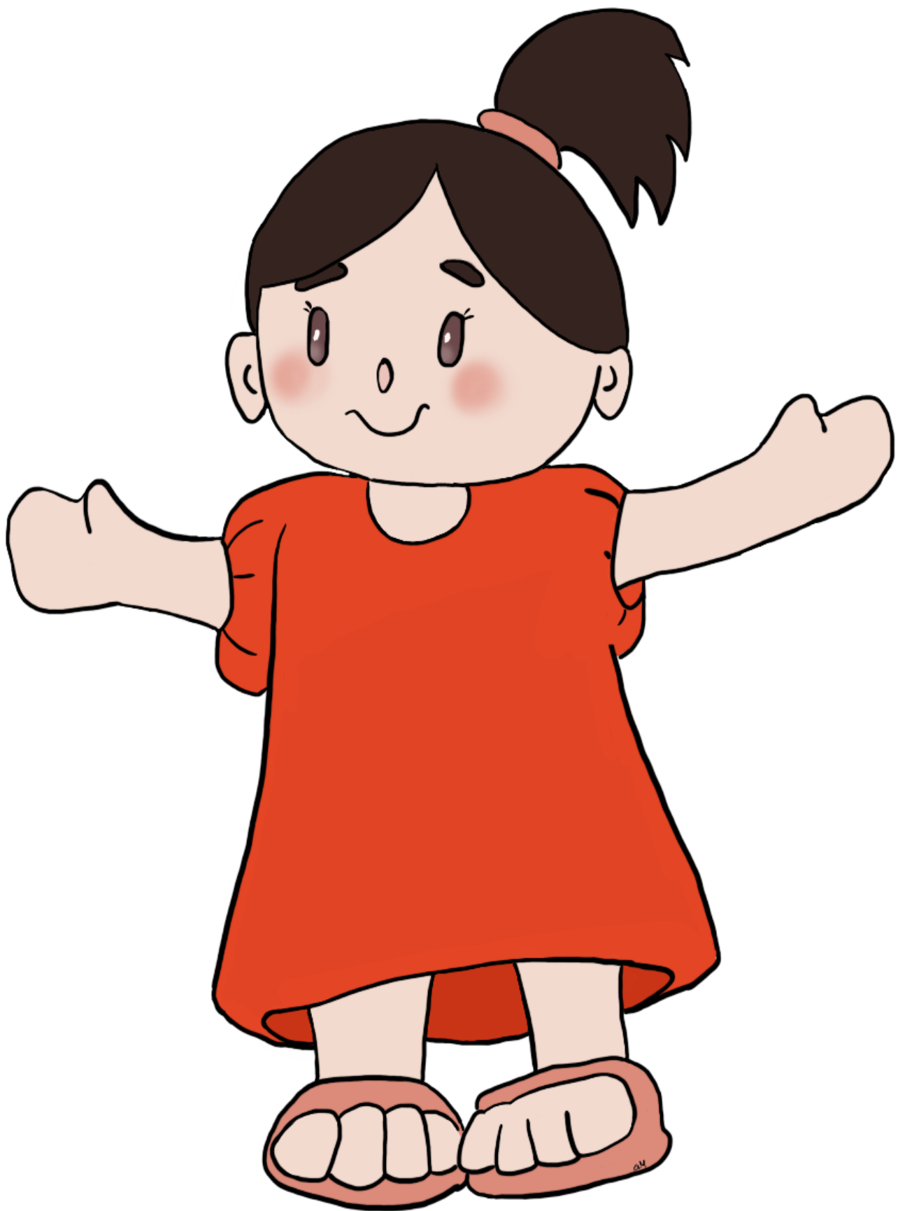
Bichette la petite sœur