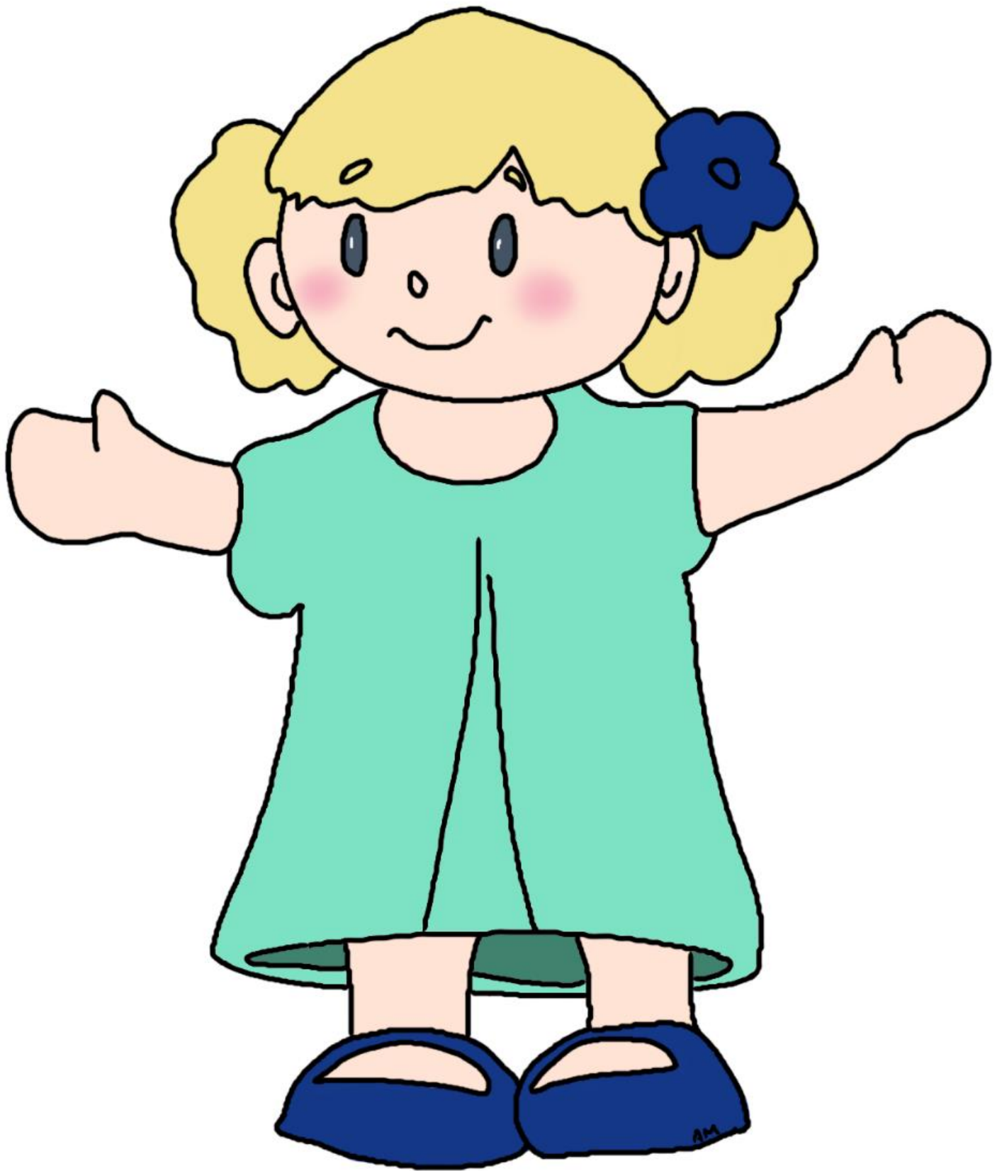
Philothée l'amie d'Amidéo