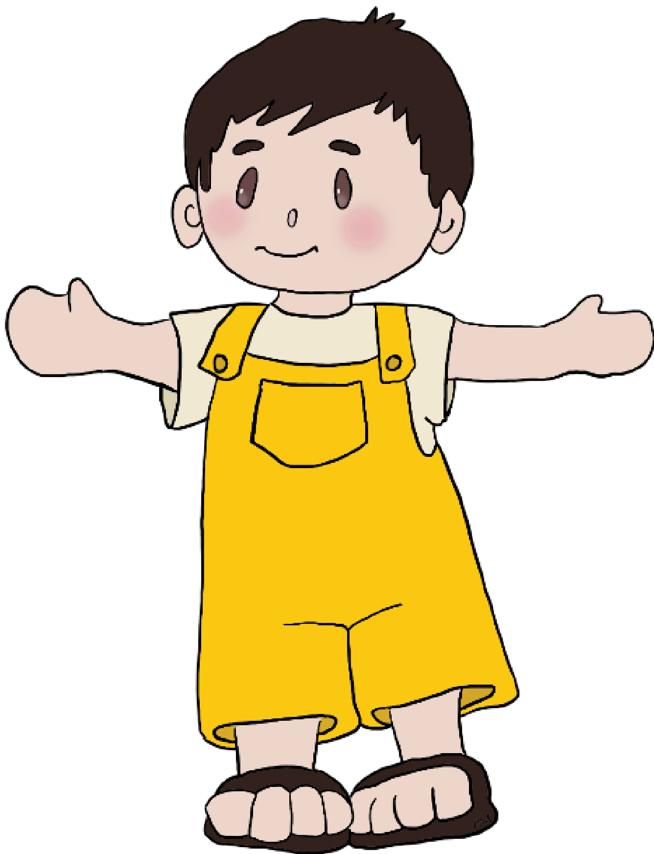
Teddy le grand frère